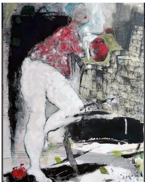
黃秀蘭 雅 (47屆全國油畫展 銅牌獎) 油畫