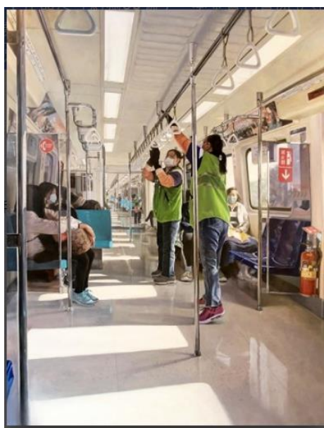
呂振揚 疫起加油 (47屆全國油畫展 銀牌獎) 油畫