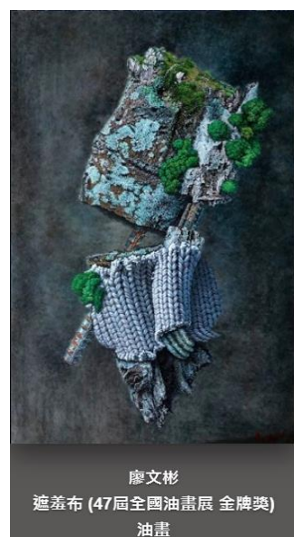
廖文彬 遮羞布 (47屆全國油畫展 金牌獎) 油畫