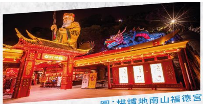
圖：烘爐地南山福德宮